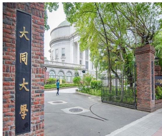
民國 113 年 大同大學