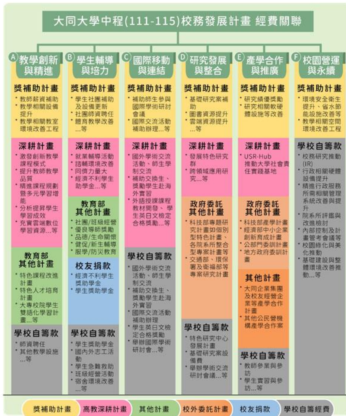
圖 5：大同大學校務發展與經費關係圖

本校以 111-115 年度校務發展計畫為總綱領，其他專案計畫為整體校務發展計畫中的一環。學校申請或執行重要的專案計畫除本計畫——「教育部獎勵私立大學校院校務發展計畫」外，尚有高等教育深耕計畫、課程相關改進計畫、科技部專題研究計畫及企業產學合作案等。各專案計畫與學校本身的教學、行政革新計畫聯合構成總體校務發展計畫。各專案計畫在經費支用上，以各自專款專用為原則，並依照相關經費核撥結報規定辦理。校務發展整體經費支用與各重要專案計畫關係圖如圖 5 所示：