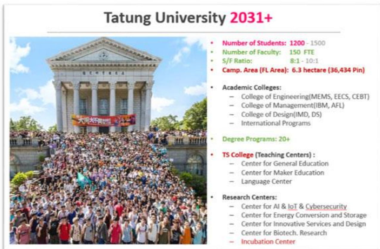
圖 2 大同大學 2031+計畫圖示

「大同大學 2031+計畫」是一個持續發展，滾動修正的規劃方案，擬議中的學校組織架構、學生規模與教師員額方案如圖 2 所示：