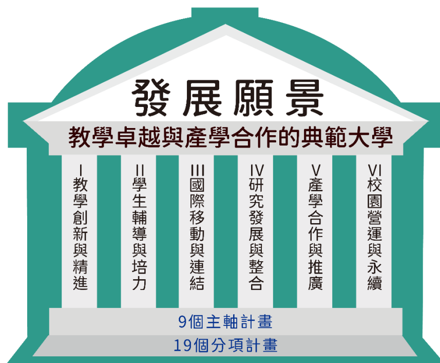
圖3：本校校務發展計畫發展策略

本校秉持長程校務發展願景「教學卓越與產學合作的典範大學」之目標，並歷經中程校務發展計畫規劃與審議機制，本期程「111-115 年度中程校務發展計畫」的階段性總體目標設定為：「深耕產學合作，深化社會參與，培育跨領域創新實踐人才；再造組織、追求卓越」與「創新校務經營，確保永續發展；充裕資源、永續經營」。為達成上述長程校務發展願景，本期中程校務發展計畫以「教學創新與精進」、「學生輔導與培力」、「國際移動與連結」、「研究發展與整合」、「產學合作與推廣」、「校園營運與永續」等六大策略面向規劃具體執行方案。整體計畫概分 9 個主軸計畫，下設 19 個分項計畫。計畫架構表與各層級計畫具體執行作法與績效指標將詳述於後續內容中。整體計畫架構如圖 3 所示：