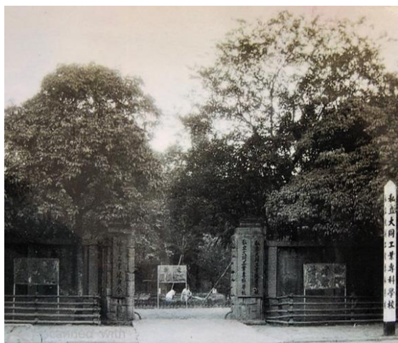
民國 45 年 大同工業專科學校