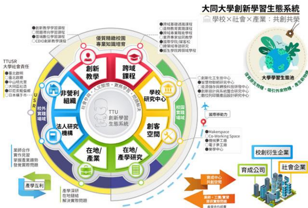
圖 4：大同大學創新學習生態系統

本校自 109 學年度起擴大挺生學院規模，轉型為全校學生皆可參與之學分學程，持續拓展跨領域教育進程。「挺生學院跨領域學分學程」，除必修課程「社會設計」、「運算思維與資料科學入門」、「媒客松」外，後續的「經營、工程與設計三大領域基礎專業課程」，學生須完成原學系領域外之兩領域基礎專業課程。因此，能區別與各院系專業學分學程之人才培育宗旨，同時亦能與學系相輔相成，精進學生跨領域學習能量。再者，「社會設計」為全校大一通識必修課程，內容設計以聯合國永續發展目標（SDGs）為主軸方向，並以 PBL 概念設計課程，課程規劃為 5 單元（「社會調查」、「設計思考」、「服務設計」、「社會設計案例」及「未來趨勢」）、3 互動（學生團隊至少須與指導老師面談 3 次）、1 團隊（不同學系背景學生組成團隊並發表專題）以推動跨領域學習；師資來源亦涵蓋全校各學系與教學單位之多樣化組成，包括 10 位授課教師及 24-30 位期末專題指導教師，且每班皆配置教學助理以解決學習相關問題。